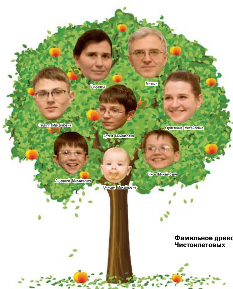
Фамильное древо Чистоклетовых