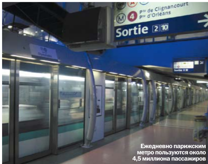
Ежедневно парижским метро пользуются около 4,5 миллиона пассажиров

2010 год стал Годом России во Франции и Годом Франции в России. В честь этого в газете «Мое метро» мы хотим рассказать об одном из самых крупных и известных метрополитенов мира – парижском.