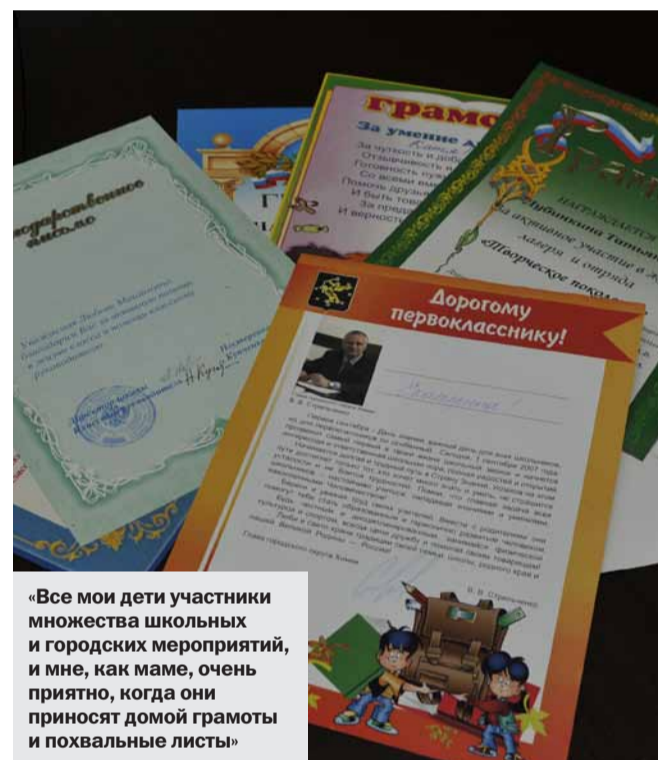
«Все мои дети участники множества школьных и городских мероприятий, и мне, как маме, очень приятно, когда они приносят домой грамоты и похвальные листы»

В круг наших забот входит и детский дом. Мы стараемся находить деткам, пока они еще маленькие, новые семьи. Конечно, мы стремимся, чтобы это были семьи из нашего города, так все же легче осуществлять контроль. В этом году решили взять в наше общество детей-инвалидов: уже дали объявление.