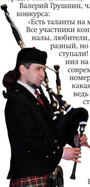
На смотре-конкурсе играли даже на вольтке

Одним словом, все конкурсанты большие молодцы и подошли к участию в мероприятии со здоровым азартом и с юмором, что тоже важно.» Подводя итоги конкурса, можно отметить, что народ всколыхнулся. И есть ощущение, что это только начало. Надеемся, что в следующем конкурсе активность будет гораздо выше. Тем более принято решение повторить конкурс во второй половине 2011 года.